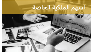
اسهم الملكية الخاصة