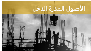
الأصول المدرة الدخل